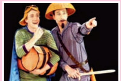
La Famille Don Quichotte