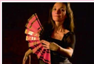
Contes en éventail