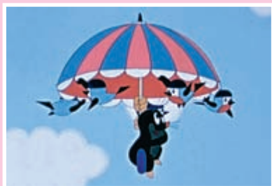
La Petite Taupe

MERCREDI 11 JANV, 15H JEUDI 12 JANV, 10H ET 14H30 AMPHITHÉÂTRE