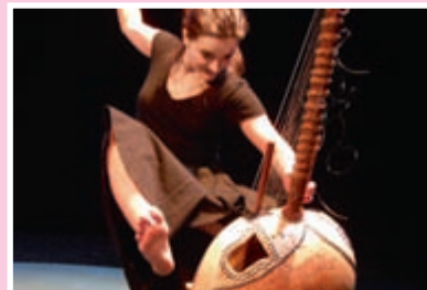
Sage comme un orage