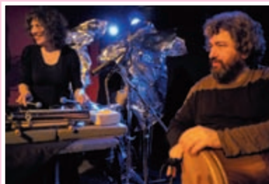
Percussions du monde

Ce concert fait partie de la thématique Rituels, la vie, la mort .