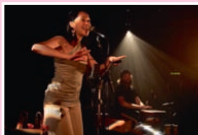
D'une île à l'autre