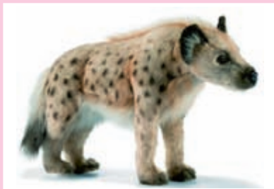
Bouki la hyène

Ce spectacle fait partie de la thématique Marionnettes .