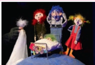
Adieu Benjamin !

Ce spectacle fait partie de la thématique Marionnettes .