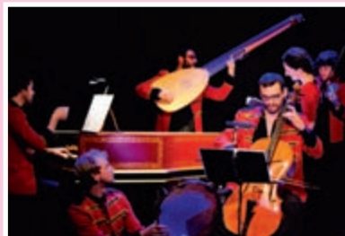
Du coq à l'âne

MERCREDI 2 MAI, 15H ET 16H30 JEUDI 3 MAI, 9H30 ET 11H AMPHITHÉÂTRE