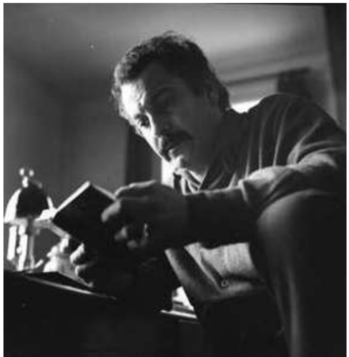
Brassens lisant, impasse Florimont, 1956