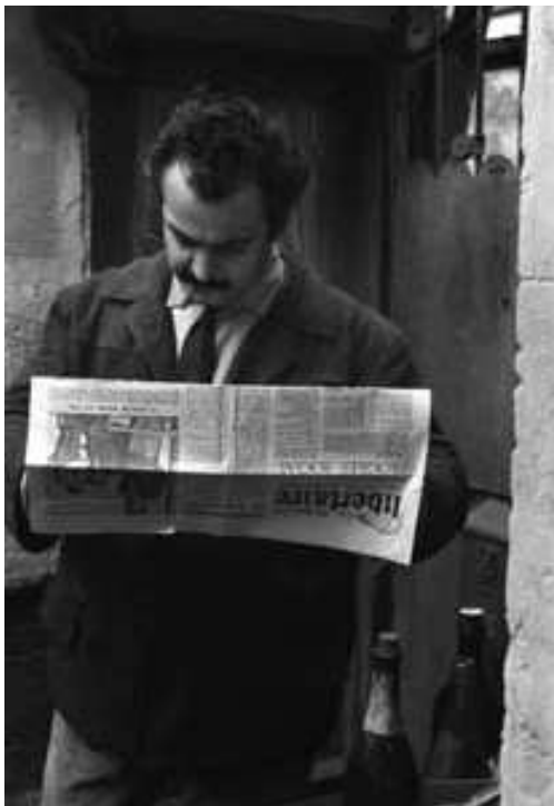
Georges lit Le Monde libertaire, impasse Florimont, 1955 •