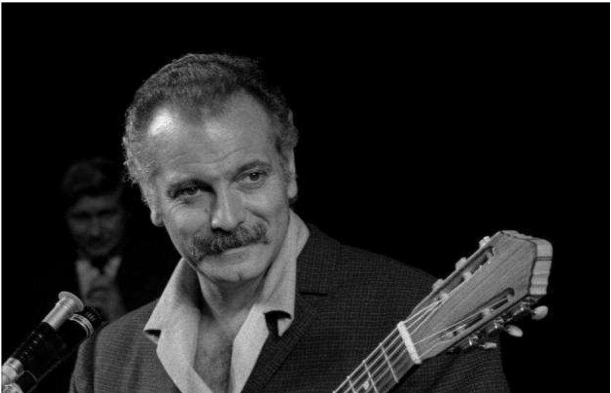
Brassens à Chaillot, 15 septembre 1966.

Les enfants doivent être accompagnés par un adulte dans les espaces de l'exposition.