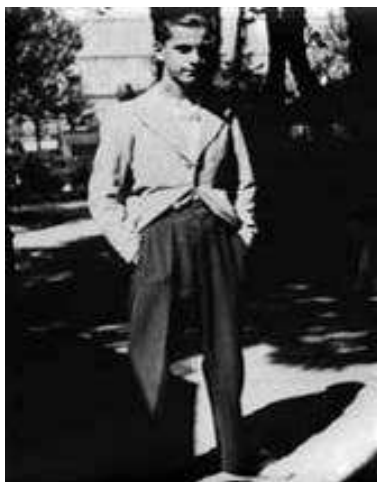
Brassens jeune homme