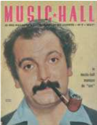
Music-hall, octobre 1955

L'exposition quitte l'intimité de la composition pour les lumières de la scène. On découvre les débuts timides de celui qui n'avait à l'origine pour ambition que d'écrire pour les autres. Plusieurs rencontres sont décisives dans la carrière de Brassens : celles avec le chansonnier Jacques Grello, la chanteuse Patachou, le découvreur de talents de l'époque Jacques Canetti. Des premiers pas sur scène dans les cabarets en 1952, à la consécration en 1954, le succès de Brassens est fulgurant. L'artiste à la dégaine d'« ours mal léché » devient un familier des grandes salles parisiennes : il se produit au TNP, à l'Olympia (9 concerts), et fait sienne la grande salle de Bobino (13 concerts !). Le sédentaire passait également de longs mois en tournée. Homme de scène, l'artiste raconte également à lui seul une histoire du disque en France, depuis l'arrivée du microsillon au succès du 33 tours. Philips inaugura une presse uniquement destinée à la production Brassens ! En 1984, il avait vendu plus de 33 millions de disques. Quand on songe que les premiers furent retirés de la vente pour cause de censure !