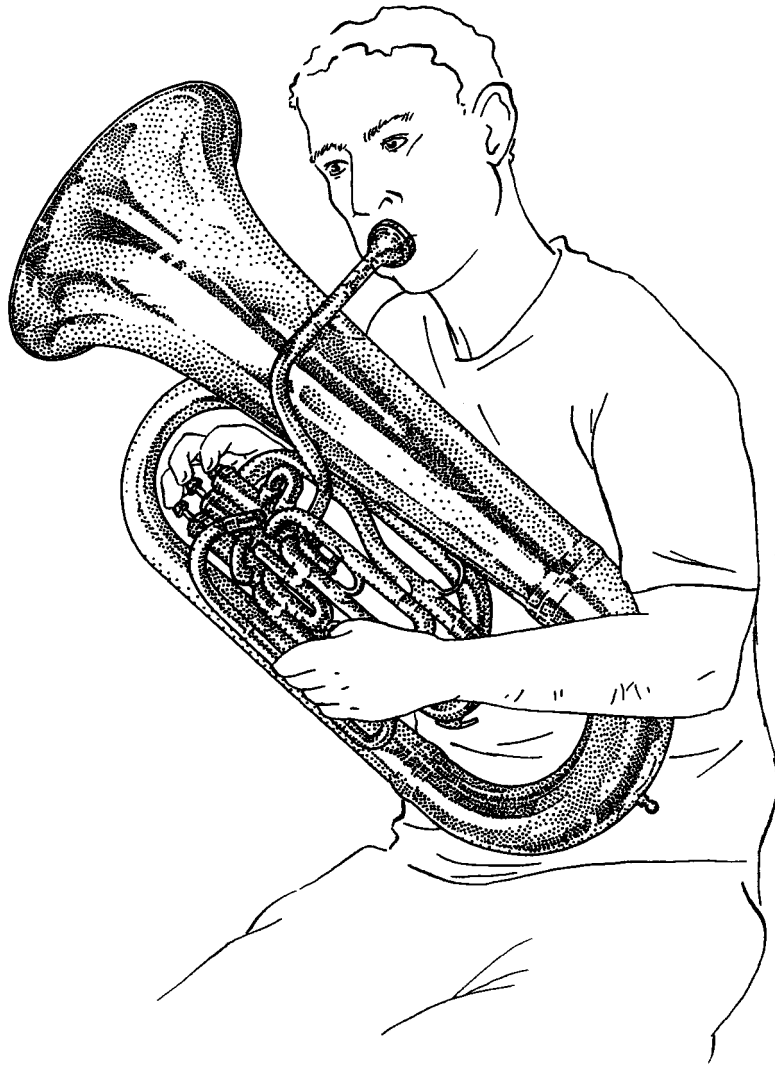
Tuba Position de jeu