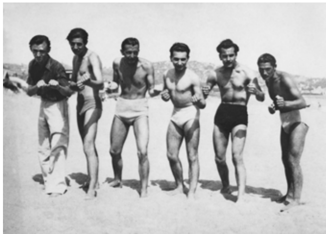
Brassens et ses amis à la plage, été 1942 • photo : Victor Laville