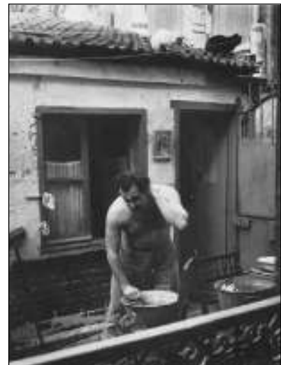
Brassens se lavant, impasse Florimont, 28 octobre 1953.