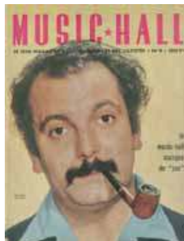
Music-hall, octobre 1955