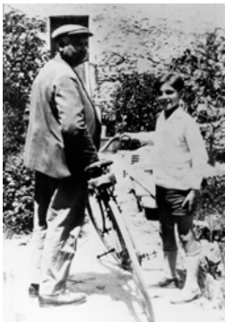
Brassens et son père à Sète, été 1942

• Le parcours explore d'abord le versant « intime » de Brassens : de ses origines à Sète à son installation à Paris, sa formation littéraire en autodidacte, son ascèse au travail. Il dévoile un univers très personnel, assez visuel, dans lequel se détache la figure d'un poète libre et original, se consacrant à l'écriture et à la composition.