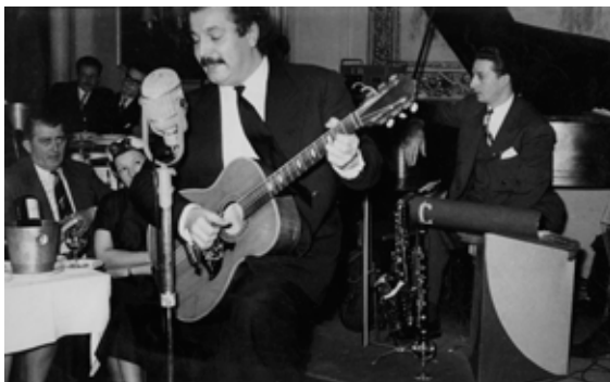
Brassens en concert à la Villa d'Este, 1953. Collection Pierre et Françoise Onteniente

• Ensuite le parcours part sur les traces du Brassens « public » , montrant les débuts timides et difficiles du chanteur sur scène, puis le rituel des grandes salles de l'époque, le rythme et la répétition des tournées, la révolution du disque, le succès auprès du public et l'ascendant pris sur toute une génération de jeunes artistes. L'entourage du chanteur et les amitiés indéfectibles créent le lien permanent, une passerelle d'un versant à l'autre, et révèlent la constance du chanteur, qui passa du souffre à la consécration.