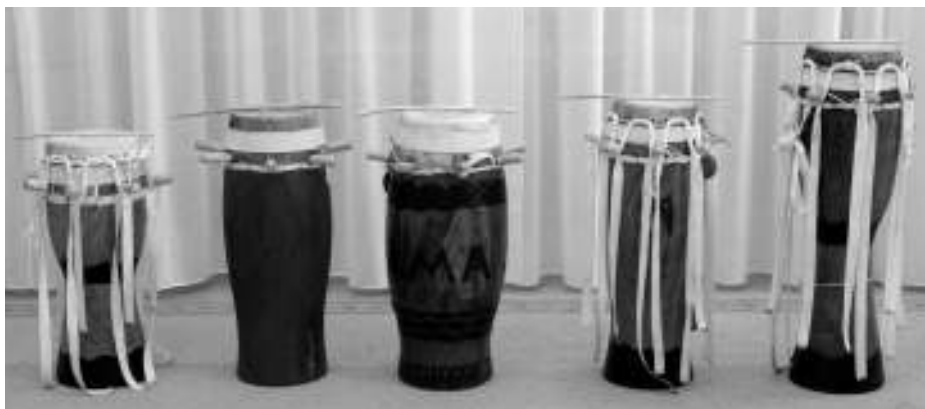
Ensemble sabar . De gauche à droite : mbëñ mbëñ , goron talmbat , làmb , goron mbabas et ndeer

Sabar désigne un ensemble de tambours de forme conique spécifique à la population wolof du Sénégal. Au sein de cet ensemble, chaque tambour a sa propre fonction : le ndeer et le goron mbabas ont un rôle de soliste tandis que le mbëñ mbëñ , le làmb et le goron talmbat assurent l'accompagnement. La hauteur des sons varie selon la taille et la forme de l'instrument ; certains tambours sont à moitié pleins et fermés à la base.