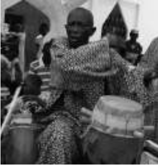
Doudou Ndiaye Rose

On ne présente plus Doudou Ndiaye Rose, percussionniste de renommée internationale, ce griot qui a marqué son époque et l'histoire culturelle du Sénégal. Dans le monde entier, il est le représentant du tambour sabar , emblème de la tradition musicale wolof. Initié très jeune au tambour sabar , consacré par Léopold Sédar Senghor « meilleur batteur du Sénégal », il a collaboré avec de nombreux artistes comme Maurice Béjart, Miles Davis, les Rolling Stones, avant d'être qualifié de « trésor humain vivant » par l'Unesco, en 2000. Son approche de la percussion est innovante. Il a inventé de nouveaux rythmes, aisément accessibles, destinés à un public passionné mais néophyte, ce qui lui a permis d'établir sa réputation mondiale.