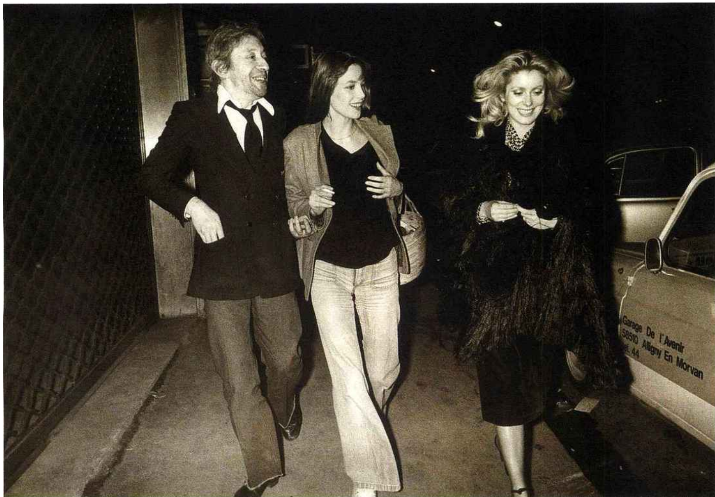
Gainsbourg à la ville en 1977, avec Jane et son panier en osier et Deneuve, en fourrure. Page de droite, look masculin/féminin en Cerruti.

Juliette Gréco, Brigitte Bardot, Jane Birkin, Bambou, Charlotte Gainsbourg, Vanessa Paradis... Les femmes les plus pointues de leur temps ont prêté et prêtent encore leur voix et leur allure au plus dandy des provocateurs. La Cité de la musique à Paris, lui consacre une exposition*.