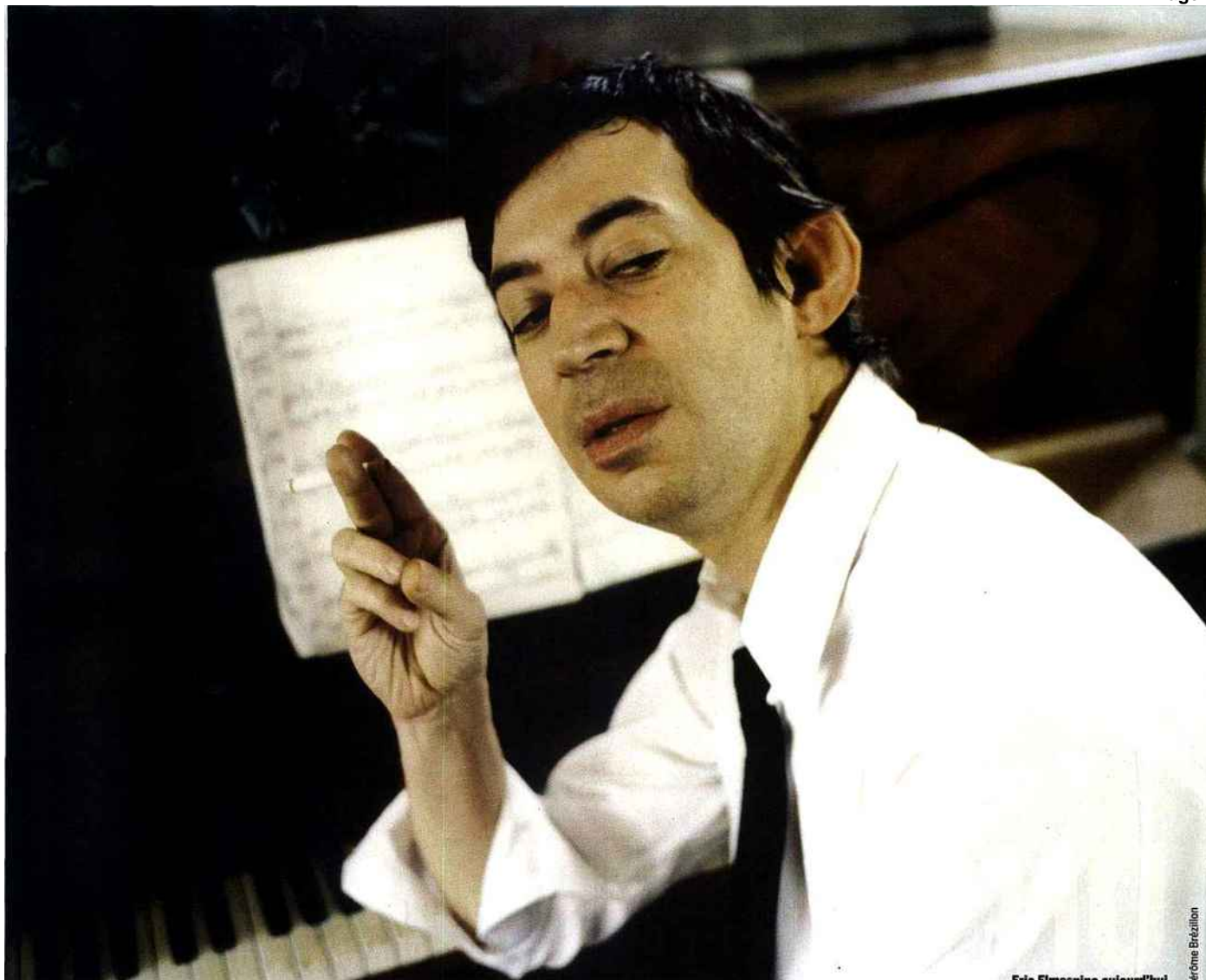
Eric Elmosnino aujourd'hui...