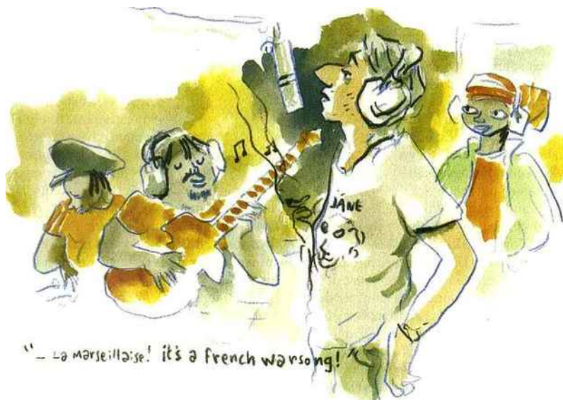
Vu par Joann Sfar

Comment t'es-tu documenté pour le film ? J'ai davantage effectué un travail sur l'œuvre que sur l'homme. L'homme, sa biographie, ses secrets intimes, familiaux, ce n'est pas mon sujet. Mon sujet, c'est la voix qui m'a bercée pendant des années pendant que je dessinais, c'est la voix de Gainsbourg chantant. Donc je n'ai pas interrogé ses proches pour savoir des choses. Je suis parti de toutes les biographies existantes et je les ai très vite oubliées pour