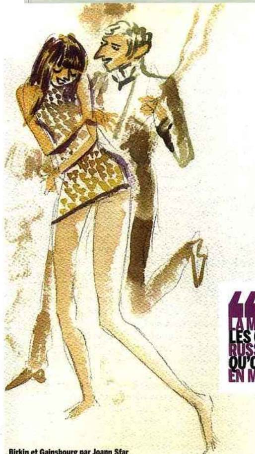
Birkin et Gainsbourg par Joann Sfar

On la connaît mal car il l'a quasiment toute détruite et c'est quelque chose dont on par- lera beaucoup dans le film. C'est l'inverse