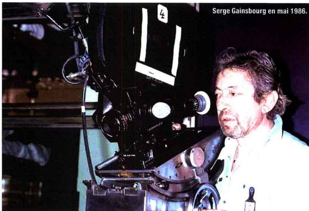
Serge Gainsbourg en mai 1986.

Gainsbourg pousse la provocation toujours un peu plus loin. Avec Equateur (1983), il débarque en Afrique. Exotisme au programme... et les bijoux de famille de Francis Huster sur fond de soupirs sensuels. Dans Charlotte for Ever (1986), il n'a pas peur de parler d'inceste, un thème déjà abordé dans Lemon Incest . Et pour le réalisme, le réalisateur et acteur principal joue le loser