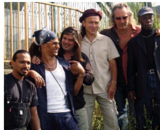
■ Bataclan. 50, boulevard Voltaire, 11°. Tél. 01 43 14 35 35. A 19 h 30. 27,50 €.

Les membres de ce groupe jazz funk formé voilà plus de vingt ans mènent à présent chacun de leur côté de fructueuses carrières. Mais ils ne résistent jamais longtemps à l'envie de se retrouver afin de groover tous ensemble, d'autant plus qu'ils savent qu'un public conséquent attend lui aussi ces rendez-vous avec impatience ! Palabre (Futur Acoustic/Harmonia Mundi).