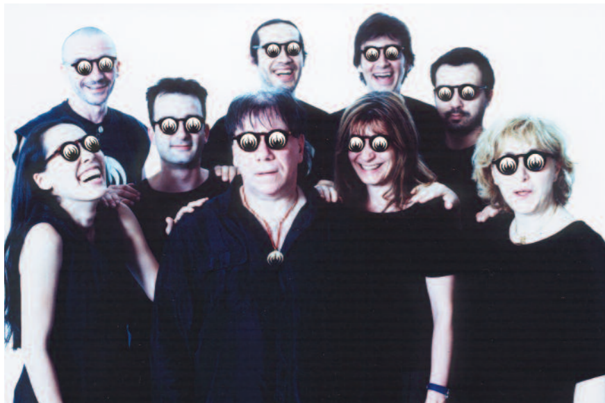
Trois dates spéciales autour d'un concert anniversaire, celui des 40 ans de Magma, au Casino de Paris.