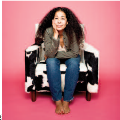
■ L'Alhambra. 21, rue Yves-Toudic, 10°. Tél. 01 40 20 40 25. A 20 h. 36,70 €.