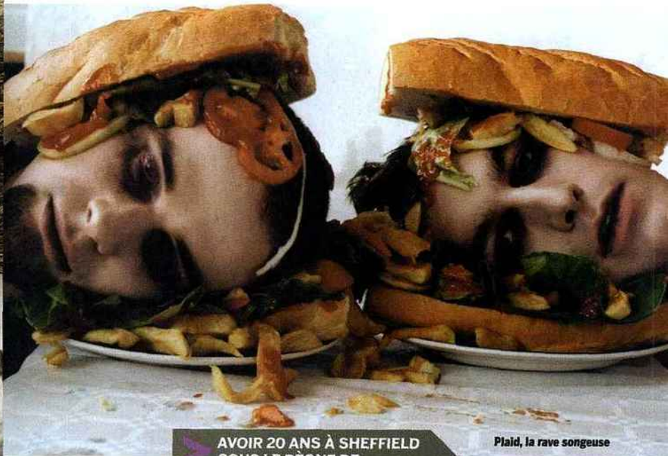
Plaid, la rave songeuse

de génie atrabilaire du fond de son bunker londonien ou de sa retraite campagnarde (même si les rumeurs d'un nouvel album sont confirmées par Steve Beckett).