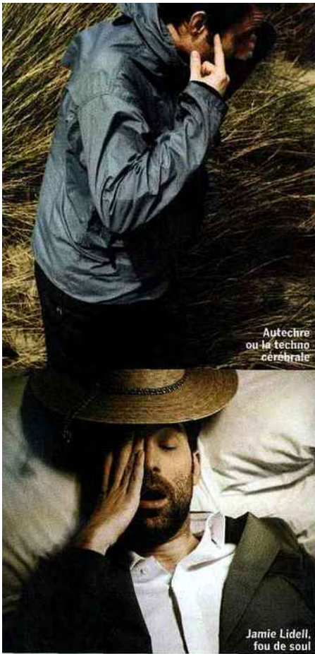
Autechre ou la techno cérébrale