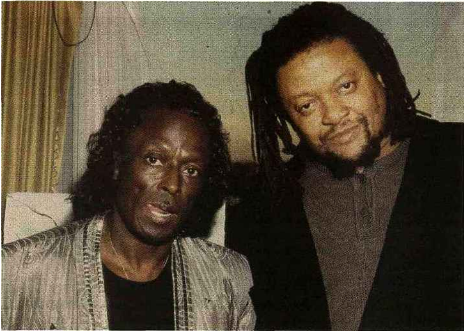
Le poète Quincy Troupe (à droite), avec son ami Miles Davis.