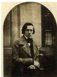
Daguerrotype de Chopin par Louis-Auguste Bisson

Tel. 01 44 84 44 84 | Tarifs : de 4 à 8 €