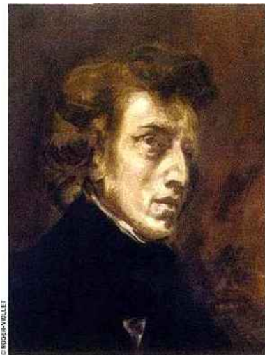
Frédéric Chopin, par Eugène Delacroix