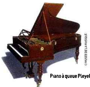
Piano à queue Pleyel