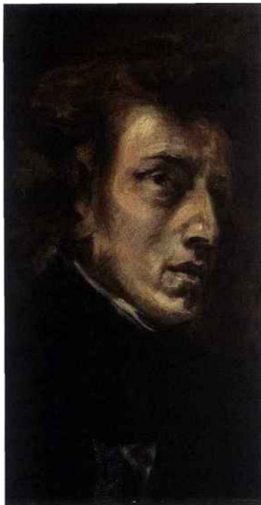
Frédéric Chopin, né le 1 er mars 1810 tout près de Varsovie, mort à Paris en 1849, est pianiste virtuose et compositeur. Son œuvre est presque exclusivement consacrée au piano.